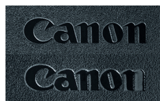
Logotipo de la batería genuina (parte superior) y la batería falsa (parte inferior)

Los productos genuinos tendrán tipografía y logotipos claros, mientras que las falsificaciones a menudo presentan una escritura poco clara y errores ortográficos. Además, las palancas y los despliegues en la pantalla de los Speedlite falsificados pueden lucir ligeramente diferentes de los Speedlite genuinos (mire la cubierta posterior).