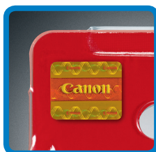
Holograma Genuino de Canon

La seguridad del cliente es de suma importancia para Canon. Las mercancías falsificadas vienen con toda clase de riesgos, los que tal vez ni siquiera ha considerado. Manténgase a salvo con las siguientes recomendaciones para detectar productos falsificados.