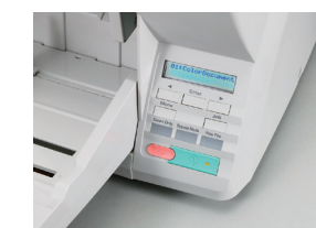
Panel de Control Intuitivo

Mediante el panel de control intuitivo del escáner DR-X10C, usted puede seleccionar botones programables y previamente registrados para "Escanear hacia Trabajos", verificar mensajes desplegados y seleccionar las fijaciones del escáner. La bandeja de alimentación se abre automáticamente al activarse el escáner. El escáner DR-X10C también cuenta con un diseño ergonómico, compacto y de peso liviano lo que agrega comodidad de manejo al operador. También incluye rodillos de alimentación reemplazables por el usuario para un fácil mantenimiento.